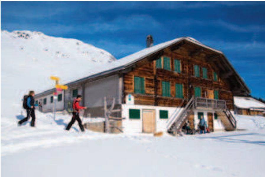
Einige einsame Höfe liegen an der Route, so zum Beispiel die Bäderalp. Im Sommer kann man hier übernachten und Käse kaufen.