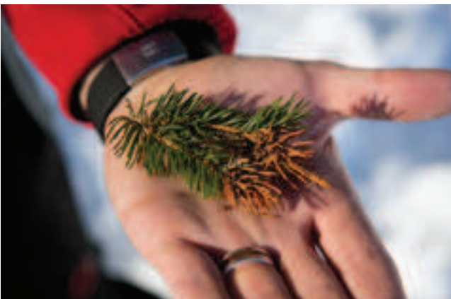
In einer Waldlichtung weisen die Auswüchse auf den Tannästen auf Blattläuse hin, die hier ihre Eier ablegen: Durch den Speichel der Larven bildet sich Galle auf den Ästen.