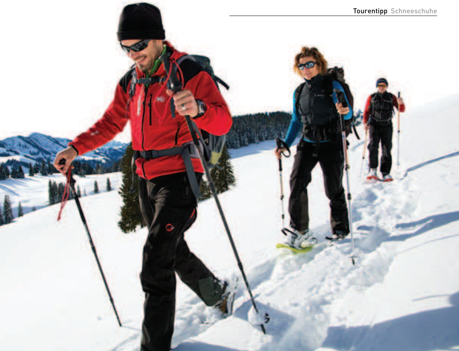
Die Querung von Pulverschneefeldern stellt die Oberschenkel der Schneeschuhläufer auf eine harte Probe.