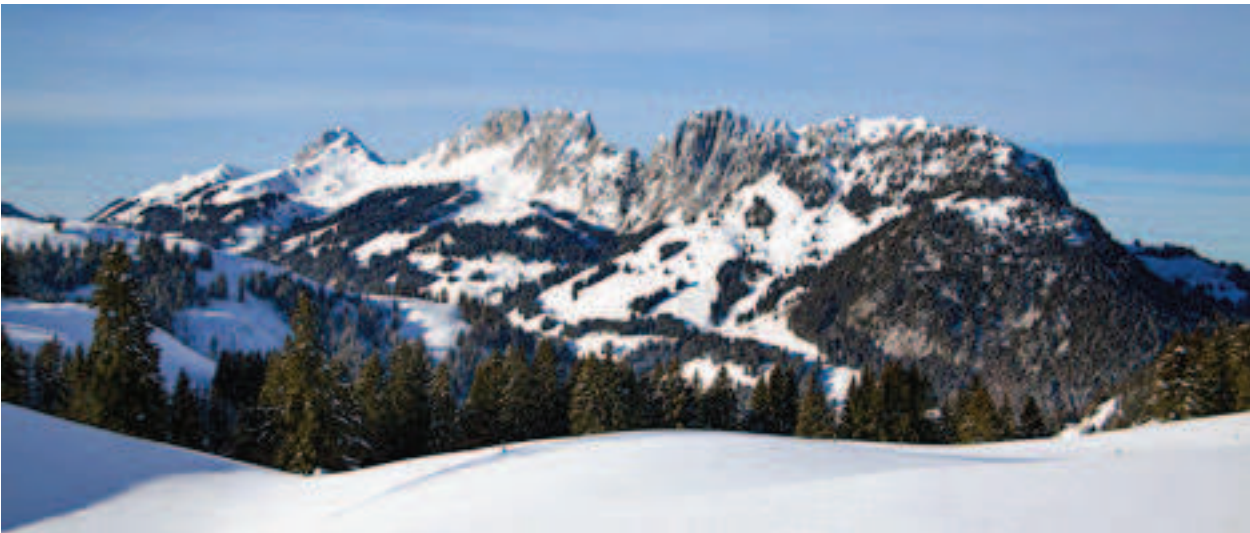
Die Kette der Gastlosen, ein alpines Massiv, das sich mitten aus der sanften Landschaft des Greyerzerlandes erhebt, ist bei Kletterern sehr beliebt.