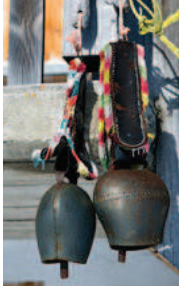
Rund um die einsamen Höfe erinnern einige Details daran, dass im Sommer Vieh diese Stellen belebt.