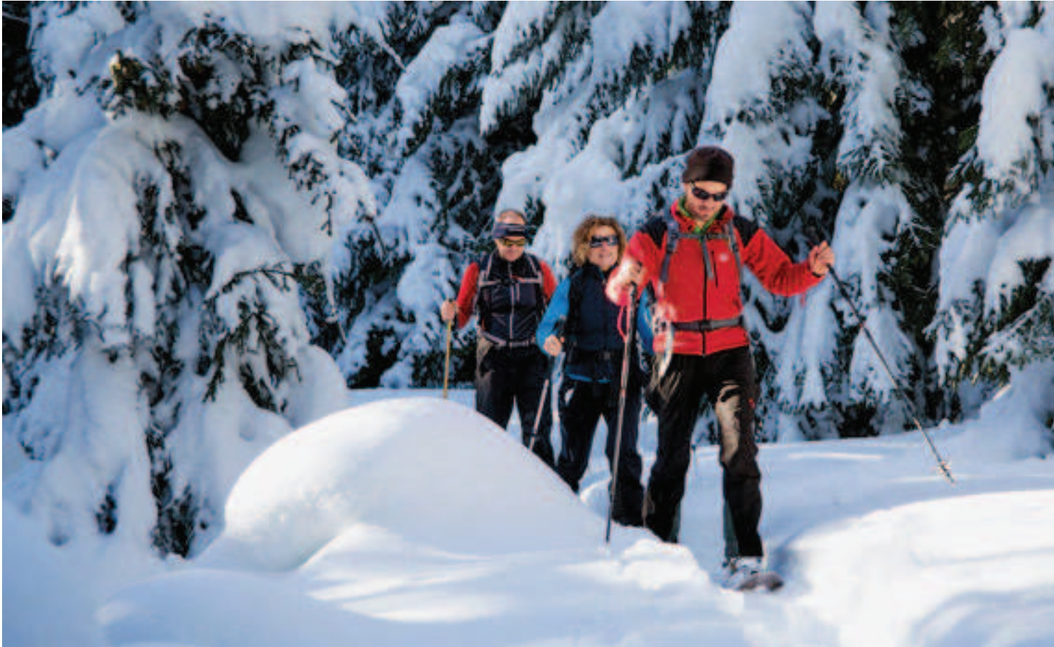
In Waldgebieten ist es Pflicht, auf den markierten Pfaden zu bleiben, um das Wild nicht zu stören.

Wald gelangt und den Panoramablick geniessen kann. An der Wegkreuzung staunt eine Kollegin über die scheinbar zum Greifen nahen Gastlosen: «Es ist speziell, diese alpine Bergkette mitten aus dem eher abgerundeten Relief herausragen zu sehen. Fast wie die Rückenstacheln eines prähistorischen Tieres!» Die Kalkfelsen sind ein altehrwürdiges, beliebtes Klettergebiet.